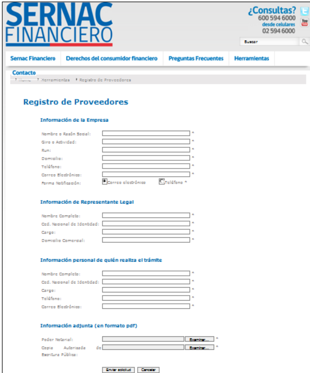
IMAGEN N° 1: Formulario de Registro de Proveedores.

El proveedor deberá completar los campos del formulario anteriormente descrito y anexar los siguientes documentos en formato PDF: