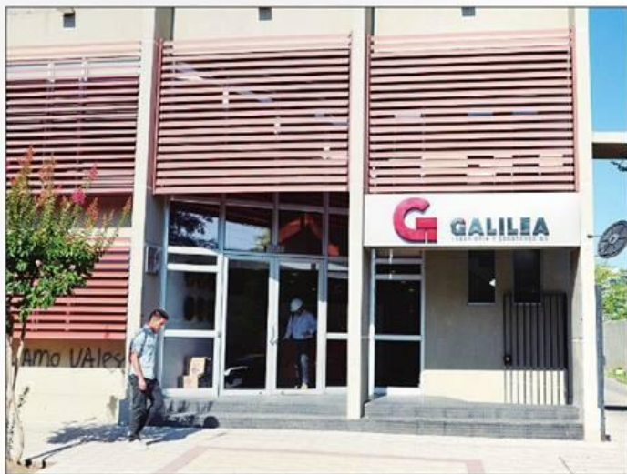
La demanda colectiva fue interpuesta en Talca, debido a que en esta ciudad se ubica la casa matriz de la Inmobiliaria Galilea S.A.

Además del incumplimiento de las condiciones ofrecidas y el retardo en la entrega de viviendas adquiridas, el servicio detectó en los contratos cláusulas abusivas que atentan contra los derechos de los consumidores