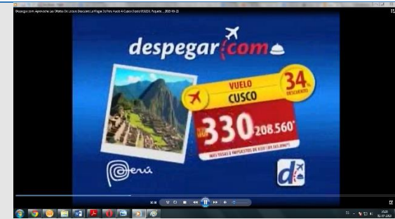
Anuncio publicitario exhibido en televisión abierta

información destacada de manera importante en una unidad monetaria distinta a la de curso legal.