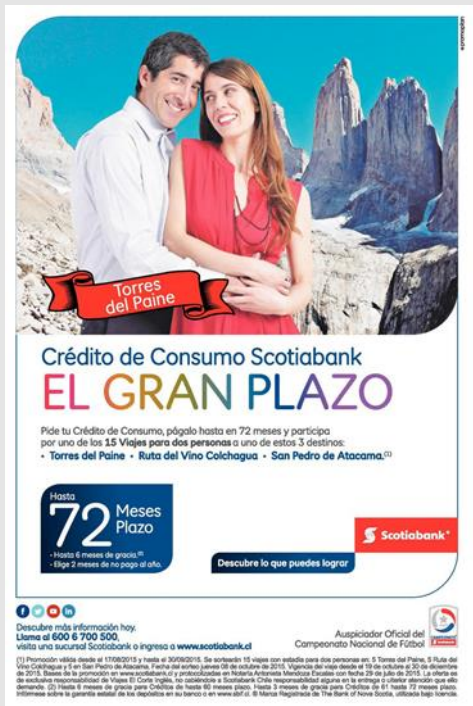
Pieza publicitaria exhibida en el Diario La Tercera. 05.09.2015