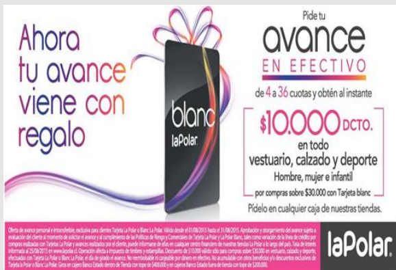
Pieza publicitaria exhibida en el Diario La Cuarta 27.08.2015