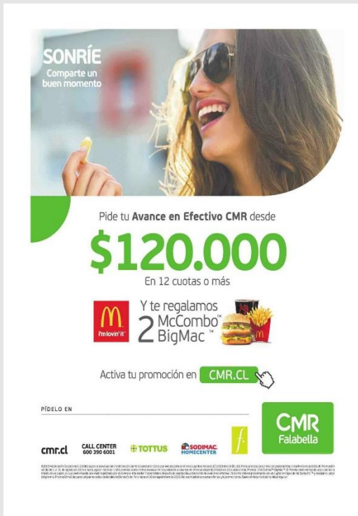
Pieza publicitaria exhibida en el Diario Las Últimas Noticias. 31.08.2015