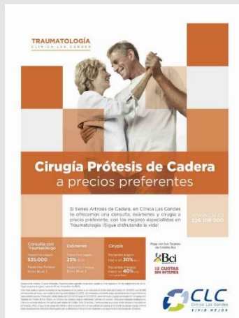
Pieza publicitaria exhibida en el Suplemento Revista Ya del Diario El Mercurio. 16.06.2015