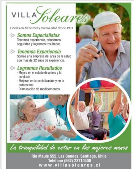
Pieza publicitaria exhibida en el Suplemento El Domingo del Diario El Mercurio. 07.06.2015