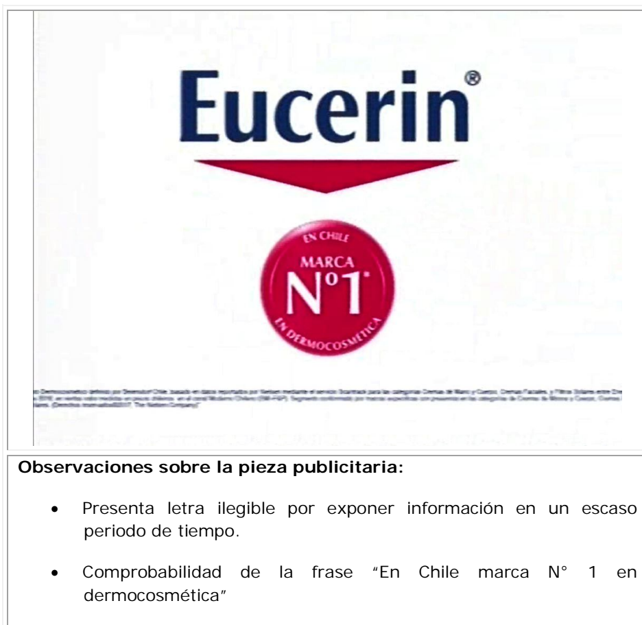
Figura 7 Proveedor: Eucerin Medio: Canal 13 Fecha de difusión: 04-05-2017