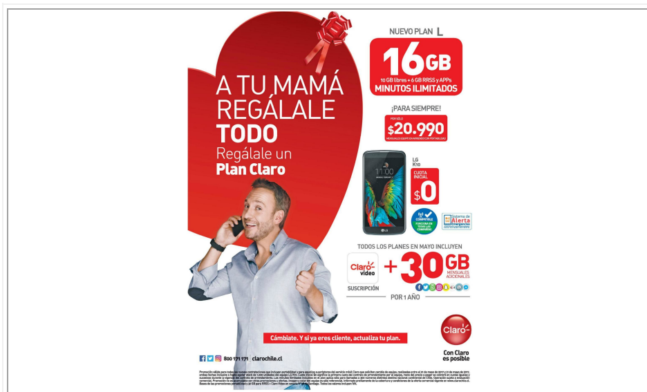
Figura 3 Proveedor: Claro Medio: Las Últimas Noticias Fecha de difusión: 04-05-2017