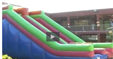
Imagen N°3: Imagen de caso de volcamiento en Chile. Visitada el 04.07.2016. recuperada de: http://www.chilevision.cl/noticias/chvnoticias/nacional/explosion-de-juego-inflable-en-colegio-de-buin-deja-una-decena-de-ninos/2014-09-12/174901.html

Otro caso que también se registró en Chile (ver imagen N°3), en septiembre del 2014 en la comuna de Buin, en el que un juego tipo tobogán explotó 5 y se volcó, aparentemente la estructura colapsó por la sobrecarga de niños que lo usaban; 27 niños resultaron con lesiones graves producto de la caída desde el juego.