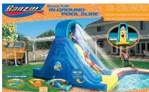
Imagen N°6: Fotografía de tobogán retirado.

En EEUU el año 2012 un tobogán de piscina (ver imagen) fue retirado debido que presentaba el riesgo de desinflarse. Entre los incidentes relacionados cuentan una muerte y dos lesiones en el cuello 8 .