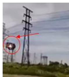
Imagen N°5: Imagen de caso de volcamiento en las Cataratas del Niagara.

También en las cataratas del Niagara, Canadá (ver imagen N°5), en junio del 2016, un juego inflable fue levantado por el viento haciéndolo chocar con las torres de alta tensión 7 .