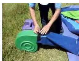
Imagen N°2: Ejemplo de turbina o soplador.

https://www.youtube.com/watch?v=c0xzrbOZKYg .