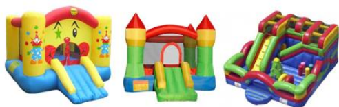
Imagen N°1; Imágenes referenciales de juegos inflables.

Los juegos inflables son estructuras usualmente de telas sintéticas, rellenos de aire que tienen diversas formas: castillos, laberintos, series de obstáculos, casas, toboganes, etc. En los últimos años su uso se ha puesto de moda y han sido incluidos tanto en juegos de centros comerciales, restaurantes como en arriendos para cumpleaños y otro tipos de actividades.