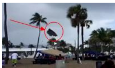
Imagen N°4: Imagen de caso de volcamiento en Estados Unidos.

En Miami, Estados Unidos (ver imagen N°4), en mayo del 2015, se registró un caso, aún más sorprendente y espeluznante, en el que un torbellino se llevó un castillo inflable con 4 niños en su interior 6 .